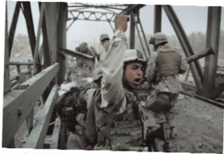
Como en Vietnam, continuar en Irak tendrá un elevado coste.

EE UU puede lograr sus objetivos... si se mantiene el tiempo suficiente y paga el precio. Pero la idea de peso que se deriva de esta situación es la de que, actuando dentro de las limitaciones impuestas por sus tradiciones y sus actitudes sociales, Estados Unidos no puede aplastar un movimiento revolucionario INSURGENTE amplio, entregado, competente y con apoyos. En sentido