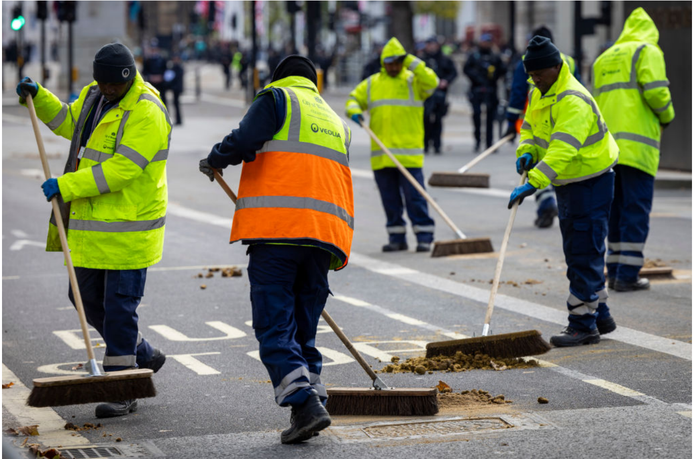
Barrenderos de Veolia que trabajan para el Ayuntamiento de Westminster barren a lo largo de Whitehall después de la apertura del Parlamento para el Rey Carlos III en noviembre de 2023 en Londres, Reino Unido.

¿Cómo las crisis económicas causan migraciones masivas a Occidente y revoluciones?